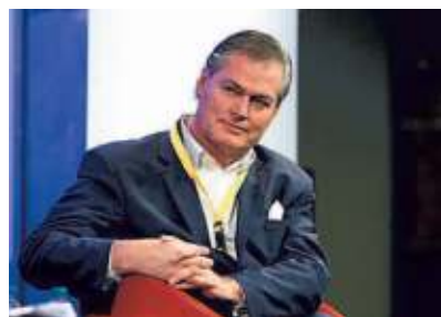
▲ Gunter Pauli Imprenditore belga, iniziatore dell'economia "blu" è stato consulente di Conte

lia, arriva in un baleno dai peggiori bar di Internet a Palazzo Chigi, quando Gunter Pauli, consulente scientifico del presidente del Consiglio Giuseppe Conte, usa i social per affermare la correlazione: "Usiamo la logica. Qual è stata la prima città del mondo ad installare le reti 5G? Wuhan! E la prima regione europea? Il Nord Italia". Ecco spiegato il percorso del virus. Sulle campagne anti 5G merita