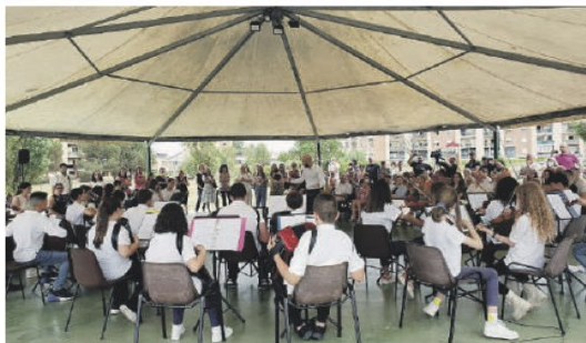
"Altre storie" In foto un momento dalle passate edizioni La rassegna a Latina torna ad animare i nuovi quartieri dal prossimo 16 giugno