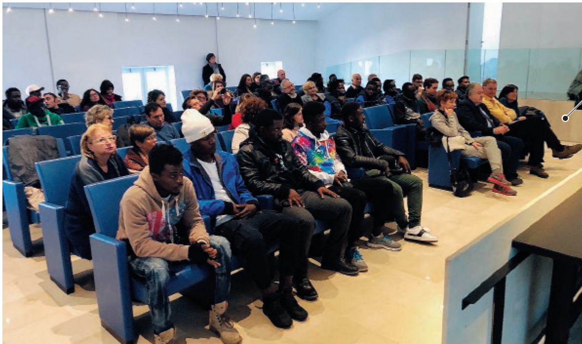
Un'immagine di una vecchia conferenza stampa con le cooperative del progetto Sprar

La protesta di Orlando ha fatto uscire allo scoperto diversi sindaci e non solo Coletta. Anche Luigi de Magistris a Napoli, Dario Nardella a Firenze e Giuseppe Falcomatà a Reggio Calabria si dicono pronti a seguirne l'esempio, e sono concordi nel dire che il decreto Salvini contiene elementi di incostituzionalità e introduce discriminazioni tra italiani e stranieri.