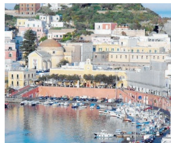
A sinistra la scuola di Santa Maria; a destra una veduta del centro di Ponza con il palazzo comunale

energetico ed il risanamento funzionale della scuola Elementare - Materna di S. Maria nel Comune di Ponza" per un importo complessivo di euro 787.056,22 di cui 613.909,84 per lavori compresi gli oneri per la sicurezza e 173.146,38 per somme a disposizione dell'Amministrazione". Una successiva delibera di Giunta redatta nell'ottobre del 2017 è stato approvato il progetto esecutivo modificato secondo quanto richiesto dall'ufficio regionale competente. Il progetto è poi approdato un mese dopo alla C.U.C., quando è stata indetta la gara d'appalto, da aggiudicare