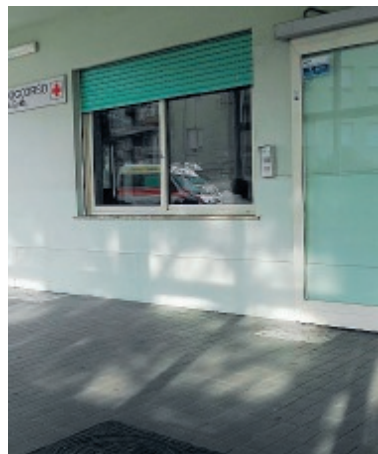
Il pronto soccorso di Formia