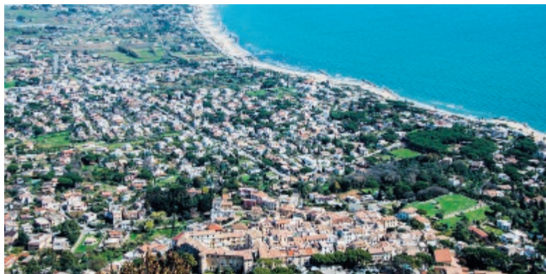
Una panoramica di San Felice Circeo

la messa in rete e a sistema di un patrimonio incredibile di beni culturali perlopiù sconosciuti e poco valorizzati. Così - aggiunge il direttore Cassola - si è potuto dimostrare come sia possibile vincere e ottenere finanziamenti sulla cosiddetta soft-economy». Il progetto scommette infatti su un potenziale enorme che è ancora inespresso: la cultura e la biodiversità. Si cerca quindi di fare impresa in modo diverso, provando a superare il turismo prettamente stagionale. «Una