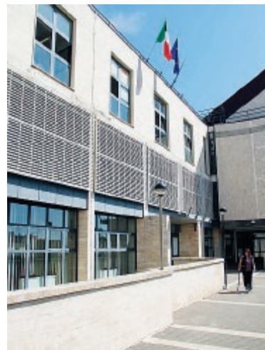
La sede del Comune di Cisterna

Assenze che facevano sorgere dubbi, ostruzionismi e un clima tutt'altro che sereno in municipio