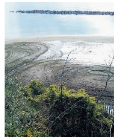
La spiaggia pulita

Una zona spesso "bistrattata". Con mezzi meccanici sono stati tolti tutti i rifiuti che, sia a causa delle mareggiate delle ultime settimane e sia per l'abbandono selvaggio degli stessi, si erano depositati sull'arenile. Ora quel tratto di spiaggia ha riacquisito un nuovo aspetto. ●