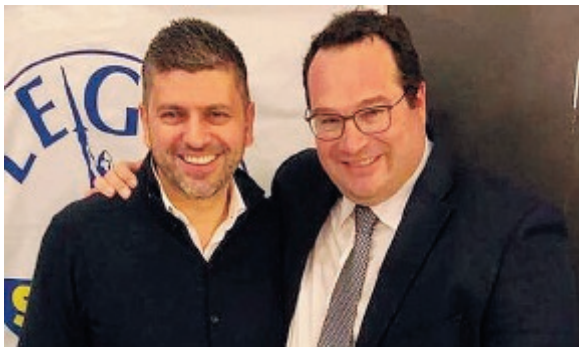
L'ospedale Dono Svizzero

Ora concluso l'iter del finanziamento, si riapre il dibattito at-