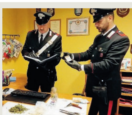
La droga sequestrata dai carabinieri a Torvajonica

Per l'uomo i soccorsi sono stati inutili. Salvo l'amico che era con lui in barca