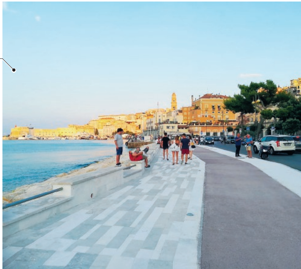
Un'immagine del lungomare di Gaeta

nostro Paese, con un turismo che andrebbe ad alimentare l'economia reale».