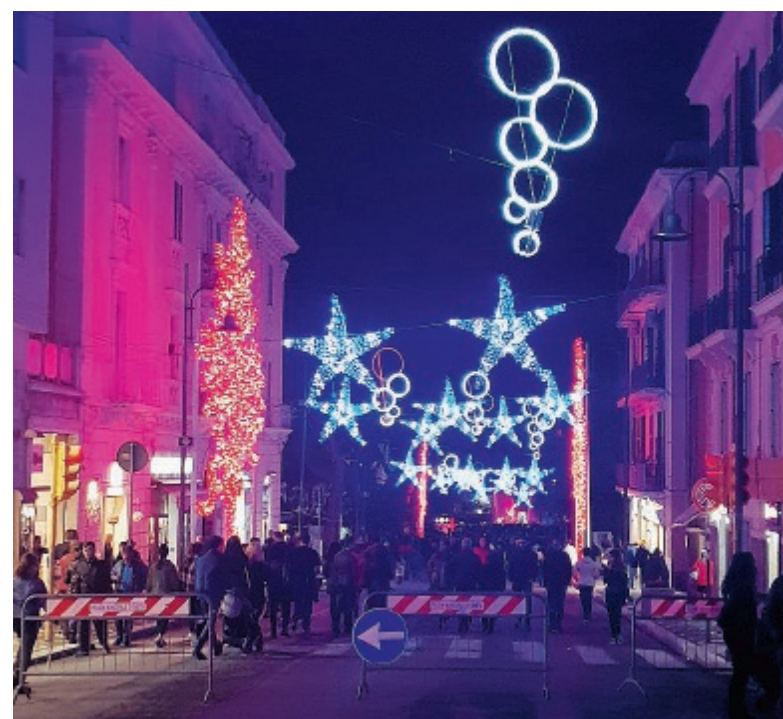
Le luminarie di Gaeta