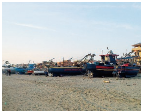
Il rimessaggio delle barche a Torvajonica

Seppure sembri verosimile l'arrivo di un'onda improvvisa quale causa del ribaltamento dell'imbarcazione, il recupero del relitto potrebbe fornire ulteriori dettagli circa l'incidente che è costato la vita al 57enne.