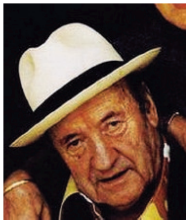
Il maestro Giacomo Manzù

Un comitato di cittadini, infatti, darà luogo a una cerimo-