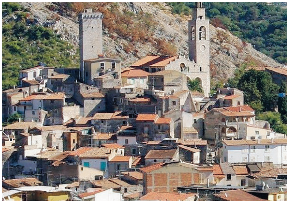
Panoramica di Castelforte

Gli abitanti chiedono l'intervento delle Autorità competenti ed eventuali provvedimenti