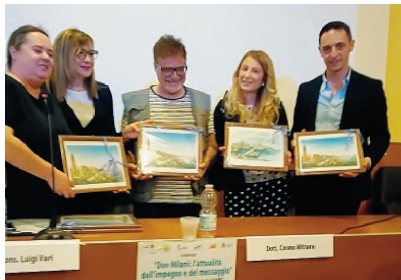
Un momento del convegno

tutto il territorio; una politica di eventi integrata tra tutte le città ed una che riguardi anche lo sviluppo della risorsa mare che bacia tutti i Comuni della "Città del Golfo", con un piano regolatore di sviluppo del waterfront condiviso stabilendo priorità in base alle peculiarità». «Abbiamo tanto da lavorare - ha concluso entusiasta di aver avuto la possibilità di lanciare il suo appello ai candidati - per questo vi aspetto a braccia aperte per cominciare a lavorare insieme». Il tutto sognando di divenire, nell'ottica comprensoriale del Golfo, competitivi a livello nazionale ed internazionale. D'altronde il patrimonio paesaggistico, storico, culturale e tutte le risorse dei luoghi del Golfo di Gaeta hanno le carte in regola per poter vincere, insieme, la sfida. ●A.D.F.