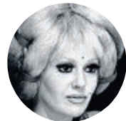
Franca Rame attrice e autrice de "Lo stupro"