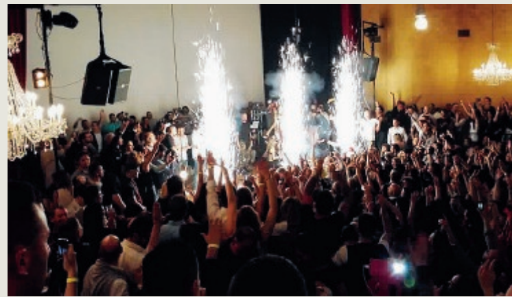
Uno scatto dalla "Reunion Progressive" dello scorso anno

Infoline: 3343700297 oppure 3332437962. ●