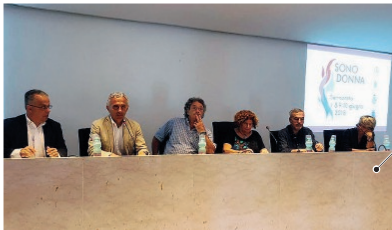
Nella foto un momento della conferenza stampa di ieri a Latina

La manifestazione si aprirà oggi alle 17 alla Loggia dei Mercanti con il seminario "Screening della mammella: dalla prevenzione al trattamento"; alle 18,30 seguirà la