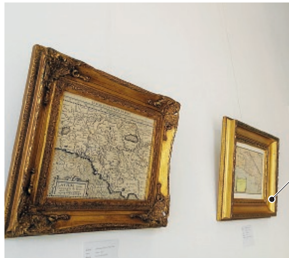
Si chiuderà domenica la mostra "Il Segno nell'arte Disegni e Incisioni dal 1600 al 1900" Un'esposizione che indaga il linguaggio e il ruolo del segno grafico o pittorico nella logica dell'opera

Restano ancora pochi giorni per visitare una mostra stupenda che racconta il territorio. Ancora una volta Galleria Papier a Sabaudia diventa uno spazio non soltanto espositivo ma anche di ricerca. Stiamo parlando della mostra "Il Segno nell'arte - Disegni ed incisioni dal 1600 al 1900". Antiche mappe, bozzetti, meravigliosi scorci, incisioni, selezionati accurata-